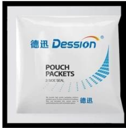
3-Sides Sealing Bag