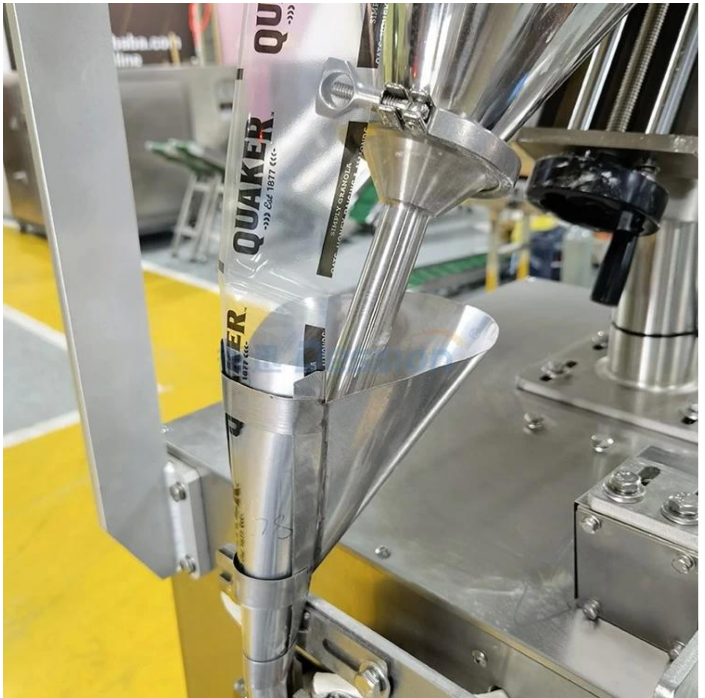
Formador de bolsa