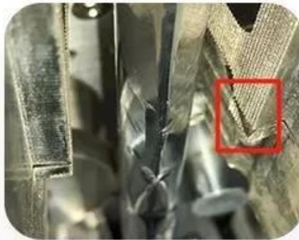
Easy Tearing Device