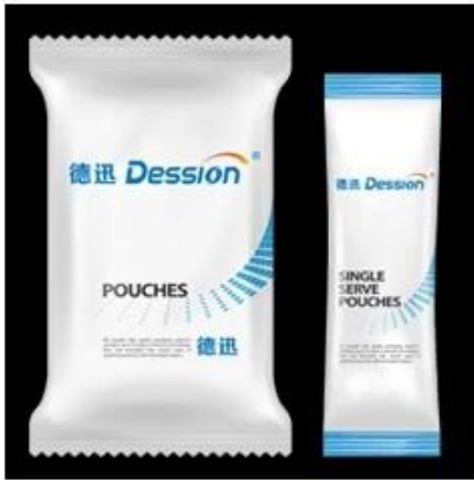
Back Sealing Bag