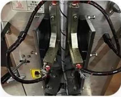
3 Sides Sealing Device