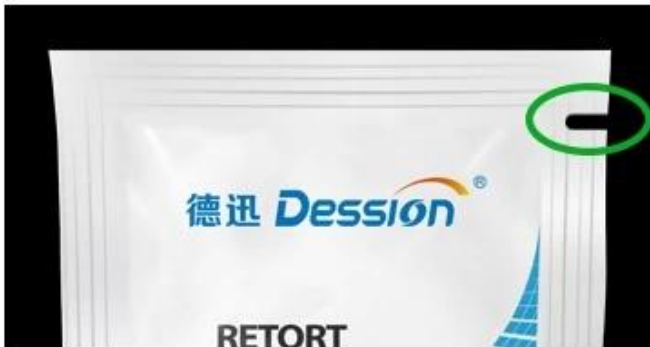
Bag with easy to tear