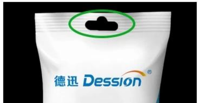
Bag with hole