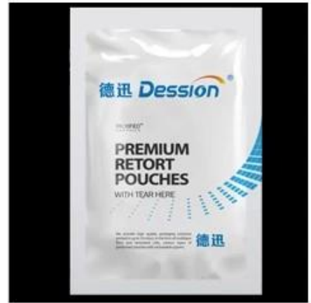
4-Sides Sealing Bag