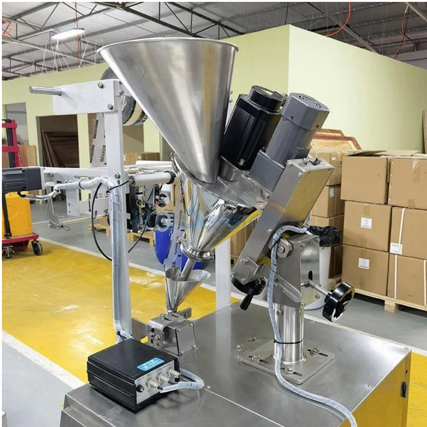
Medición de tornillo