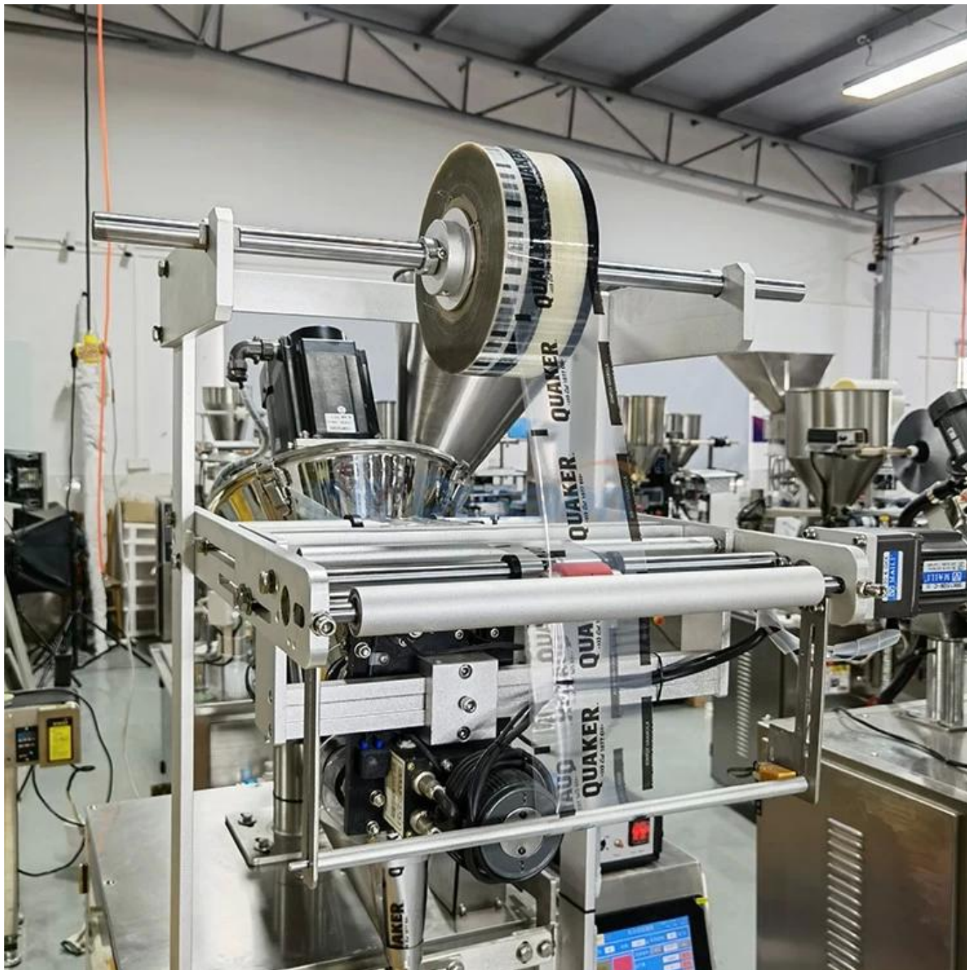
Titular de la película