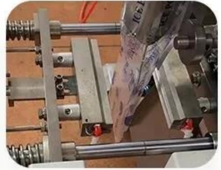
Linking Bag Device