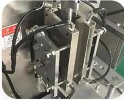
4 Sides Sealing Device