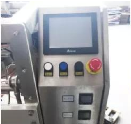
Control de pantalla táctil El idioma se puede personalizar.