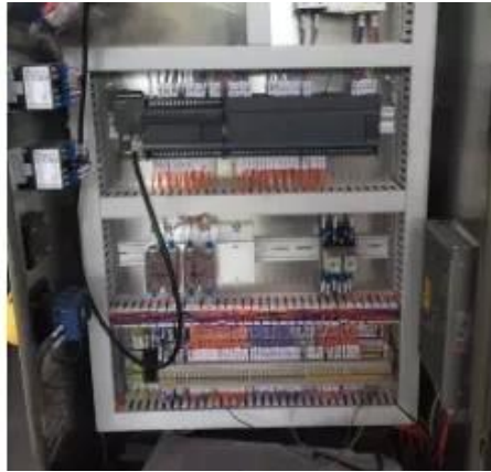
repuestos electricos importados Control PLC, inversor