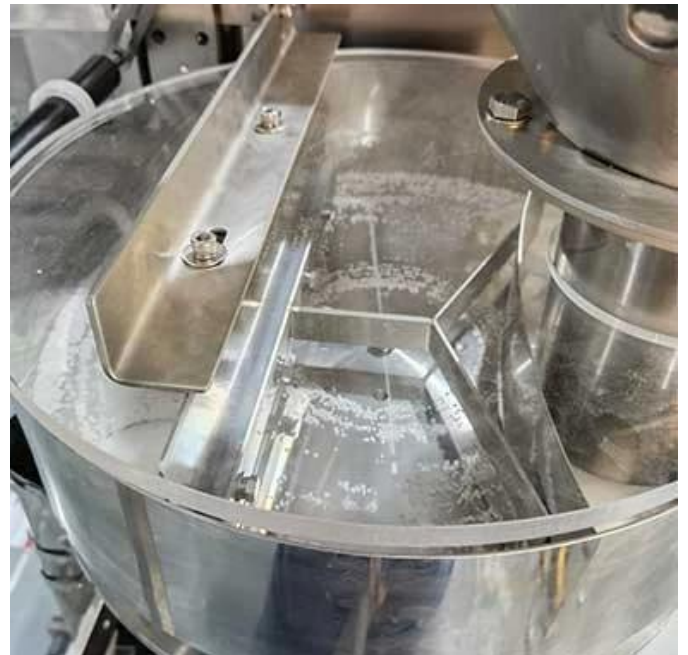
Dispositivo de taza medidora de alta precisión