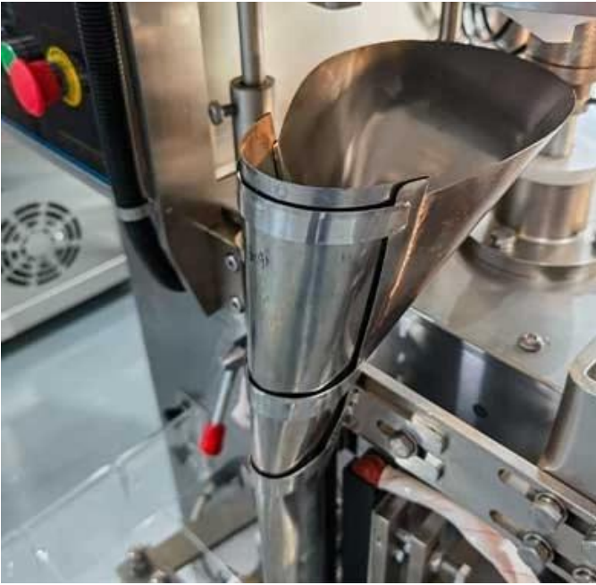
Formador de bolsas