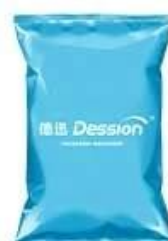
Standard back seal