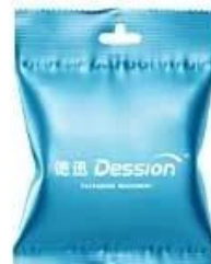
Back seal aircraft hole