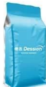
Quad seal bag