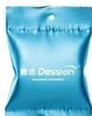
Back seal round hole