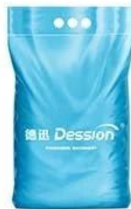
Vertical back seal