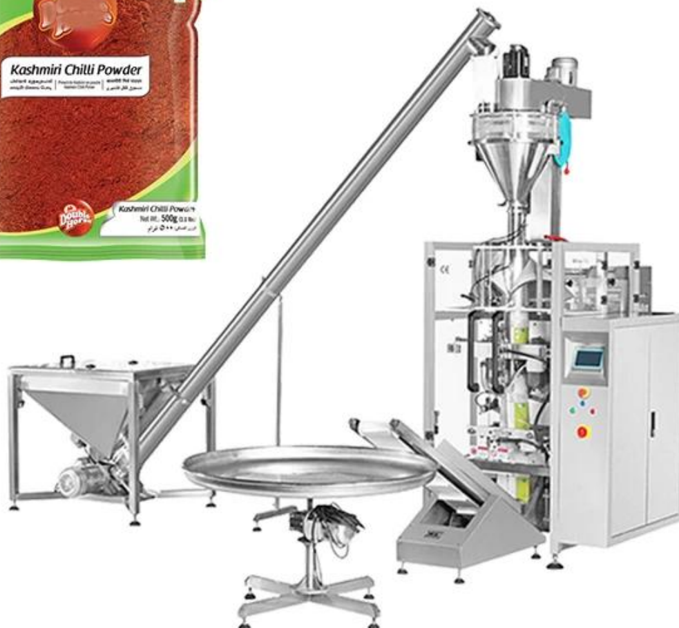
Detalles de la máquina Vista completa