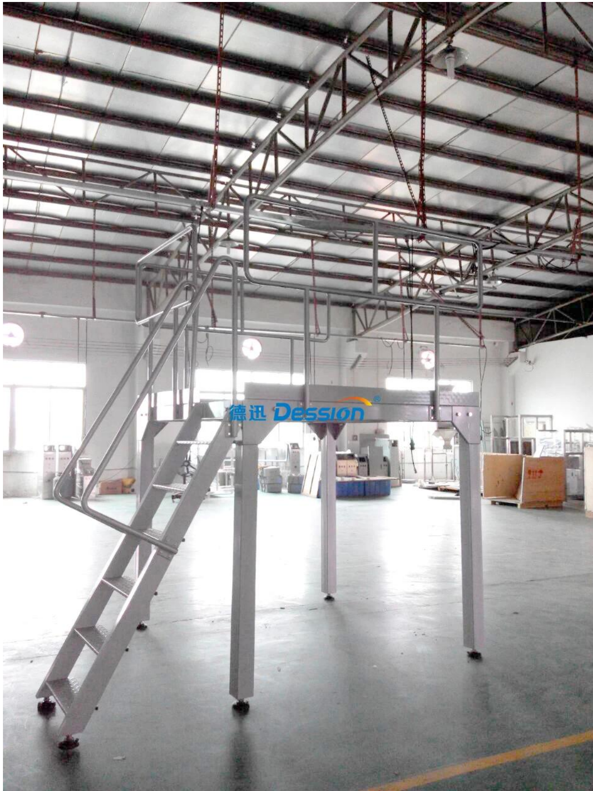
4. Elevador de cangilones tipo Z (con alimentador de vibración)