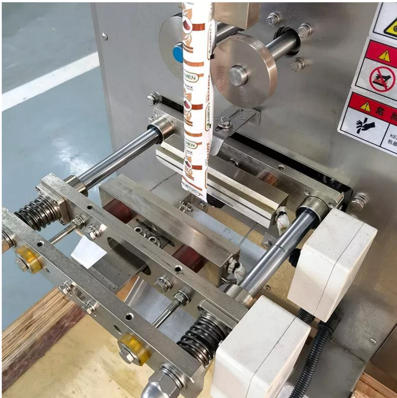
Dispositivo de corte de bolsas