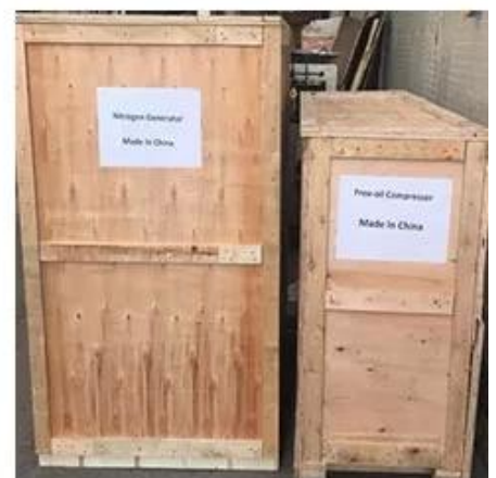
Wooden Box Packing