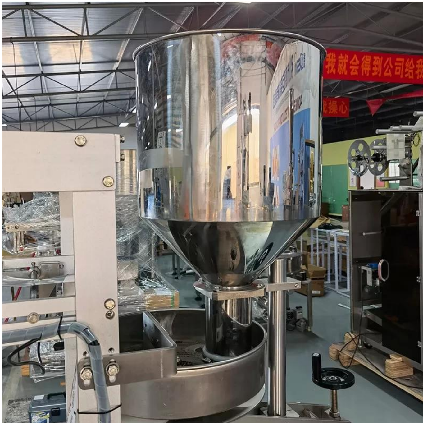
Tolva y vaso medidor