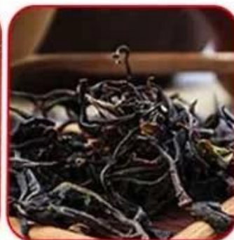
Ceylon black tea