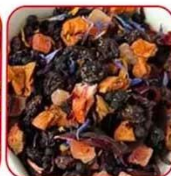
Particles of tea