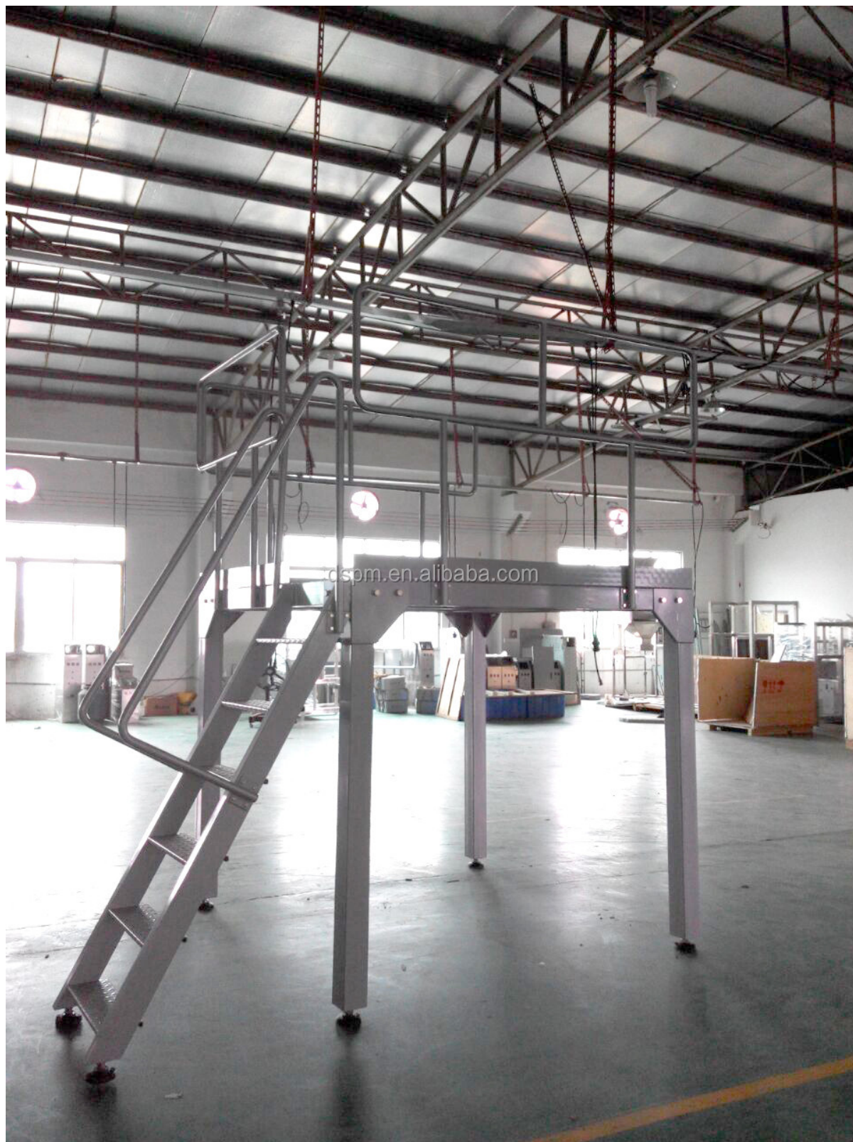
Elevador de cangilones tipo 4.Z (con alimentador vibratorio)