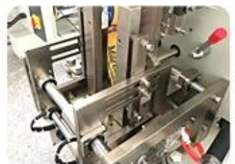
Four Side Sealing Mold