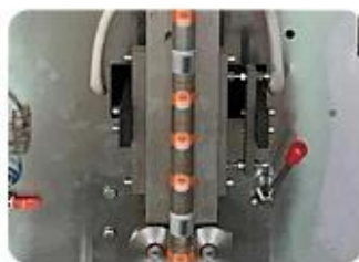
Back Sealing Mold