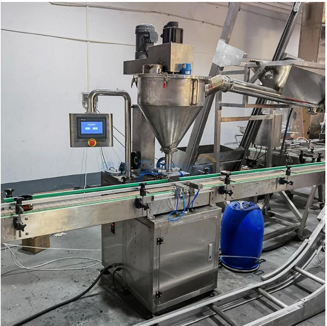
el nombre de la máquina Máquina de medición de tornillo