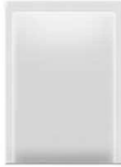
3 side sealed