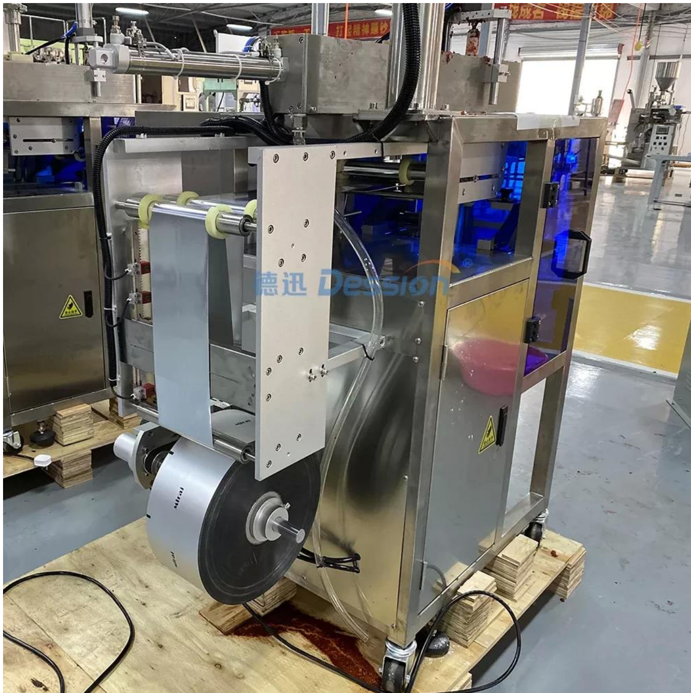
Titular de la película