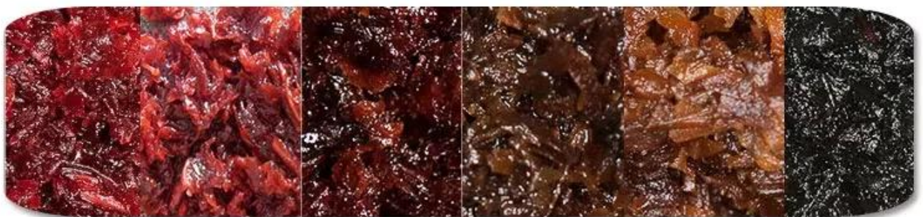
Shisha Tobacco Materail

Máquina empacadora de tabaco Dession shisha a Aplicable para algo como shisha, tabaco, narguile, etc.