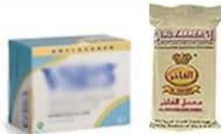
Bag Into Box