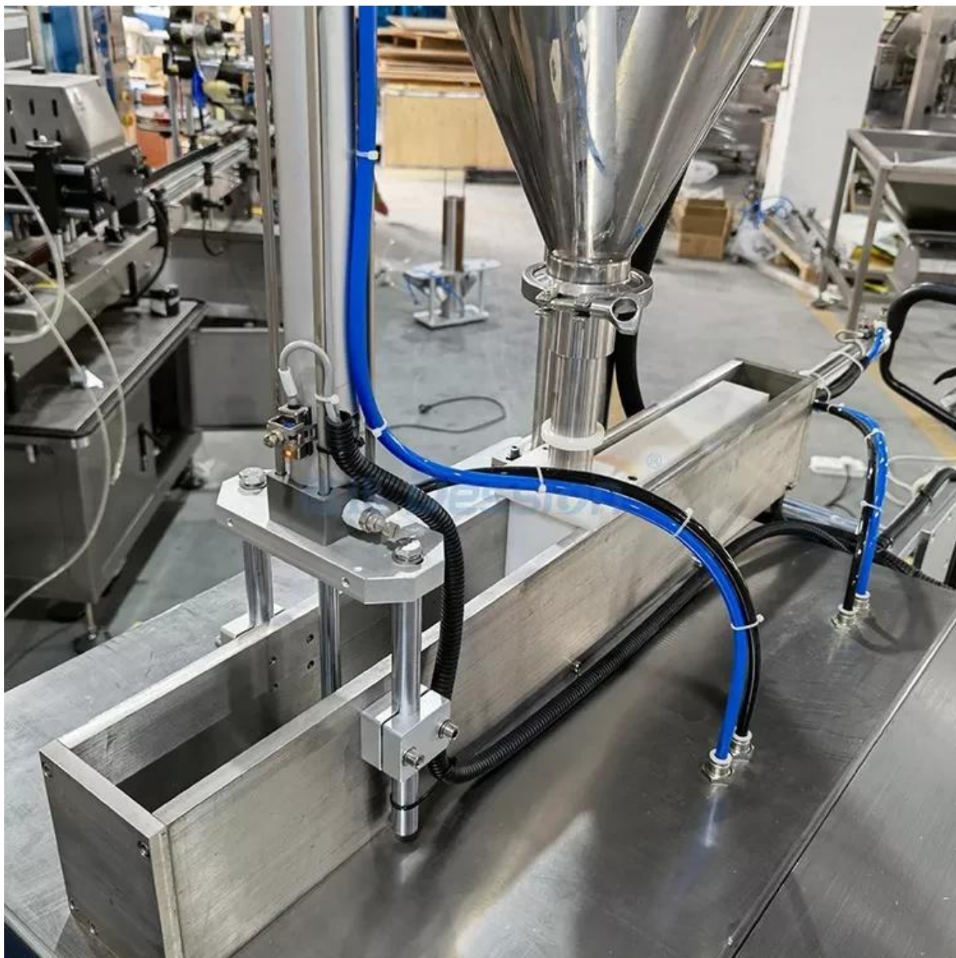
Llenado con bomba neumática