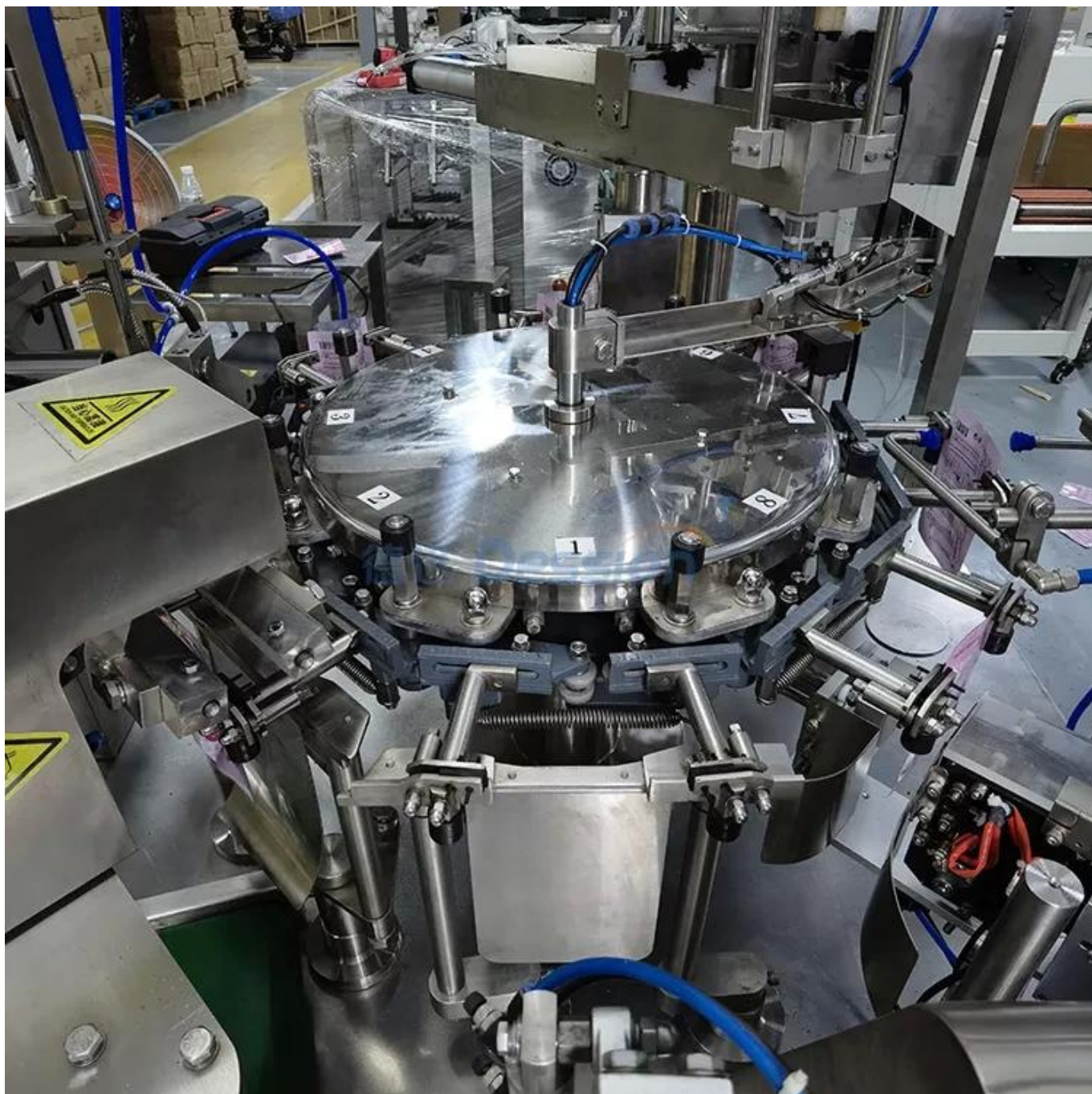
8 mesa de trabajo giratoria