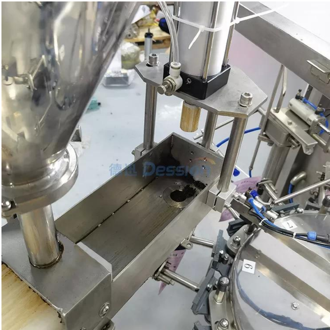
Llenado con bomba neumática