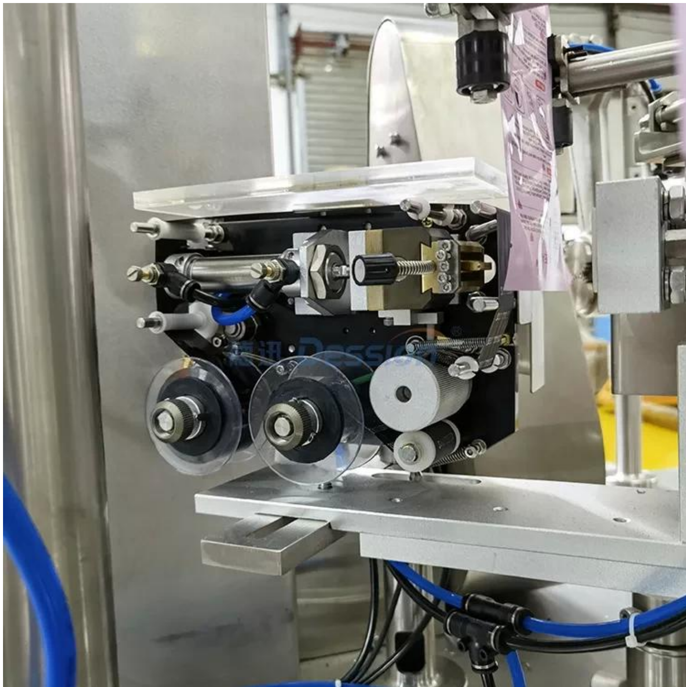
Impresora de fecha