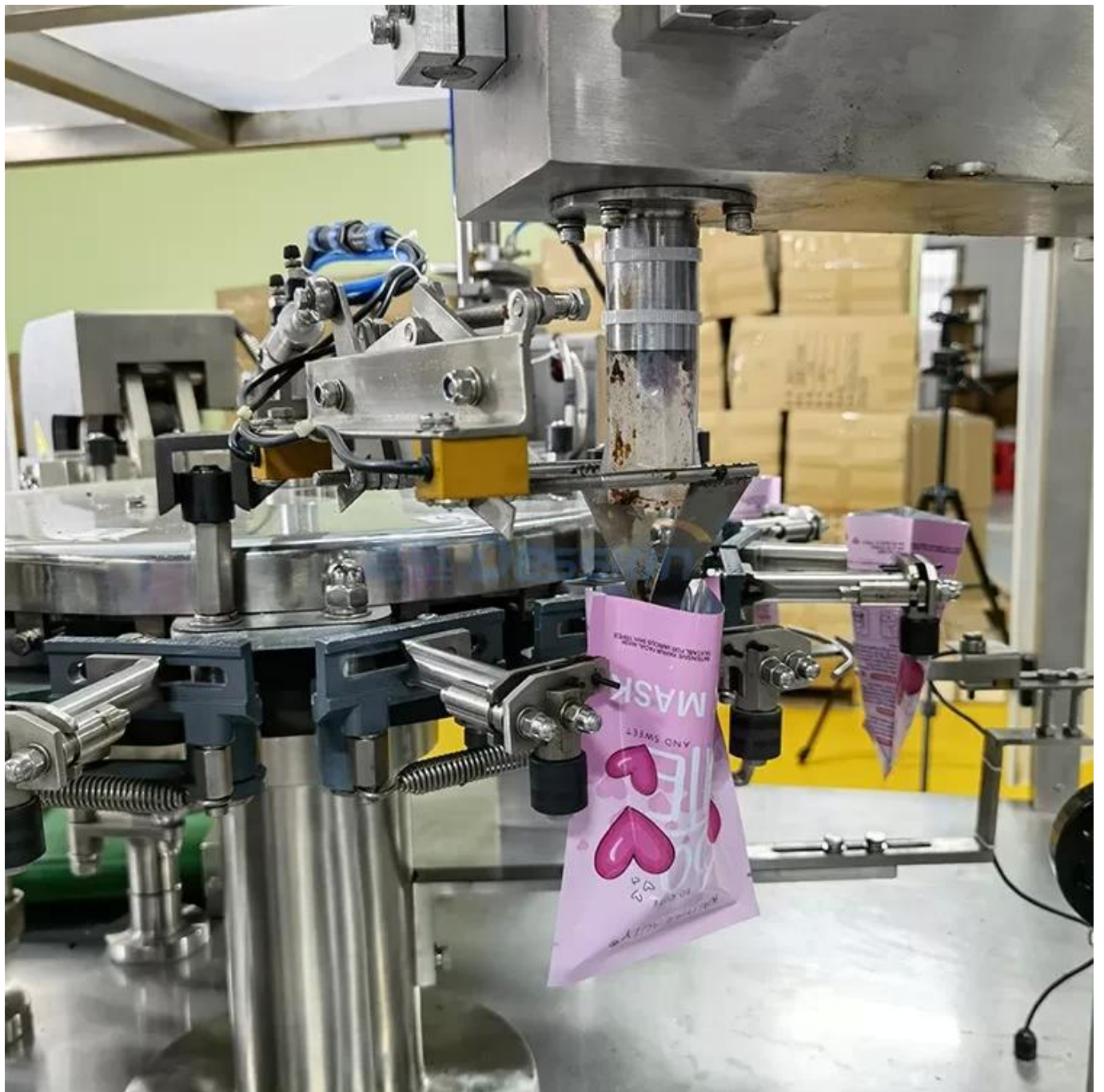
dispositivo de llenado