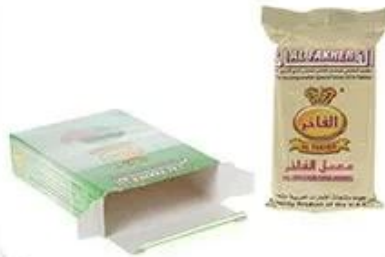
Bag Into Box