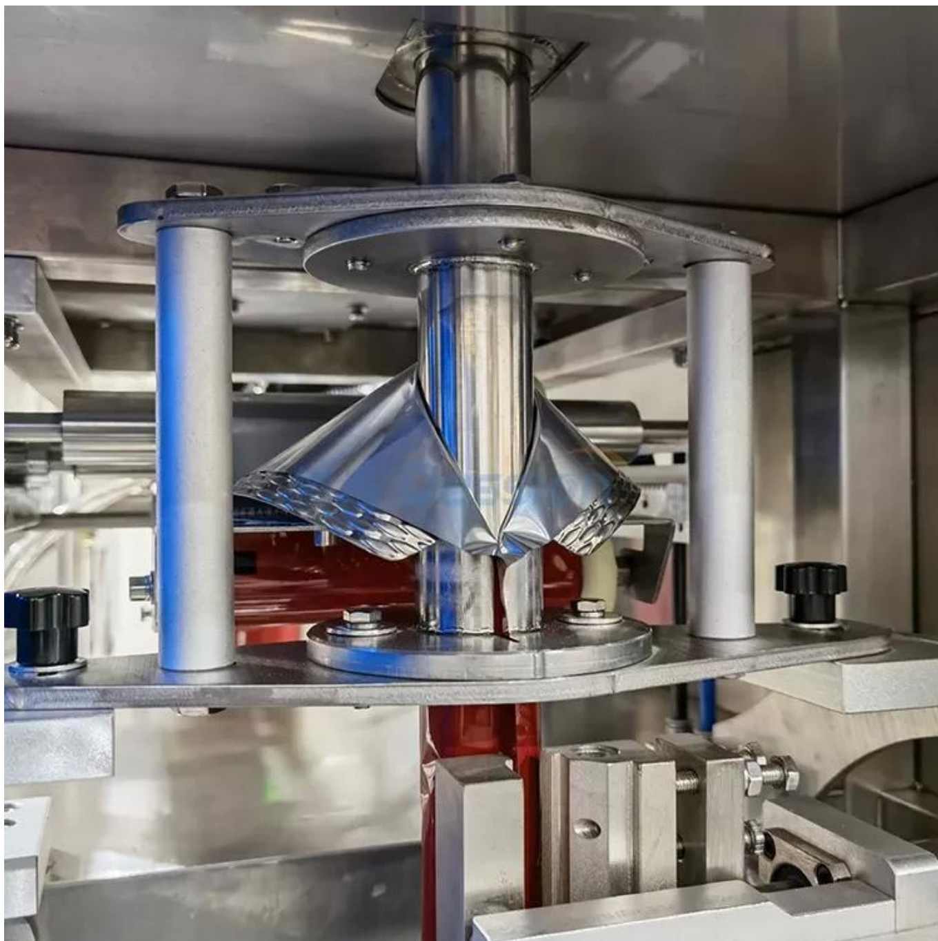
formador de bolsas