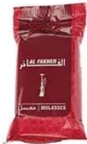
Plastic Bag Packing