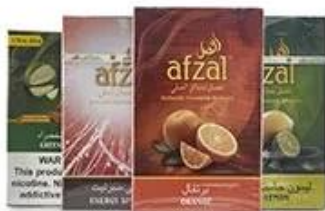
Cellophane & Tear Line Wrap