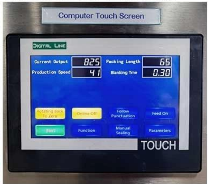
Simple operation of Chinese and English settings