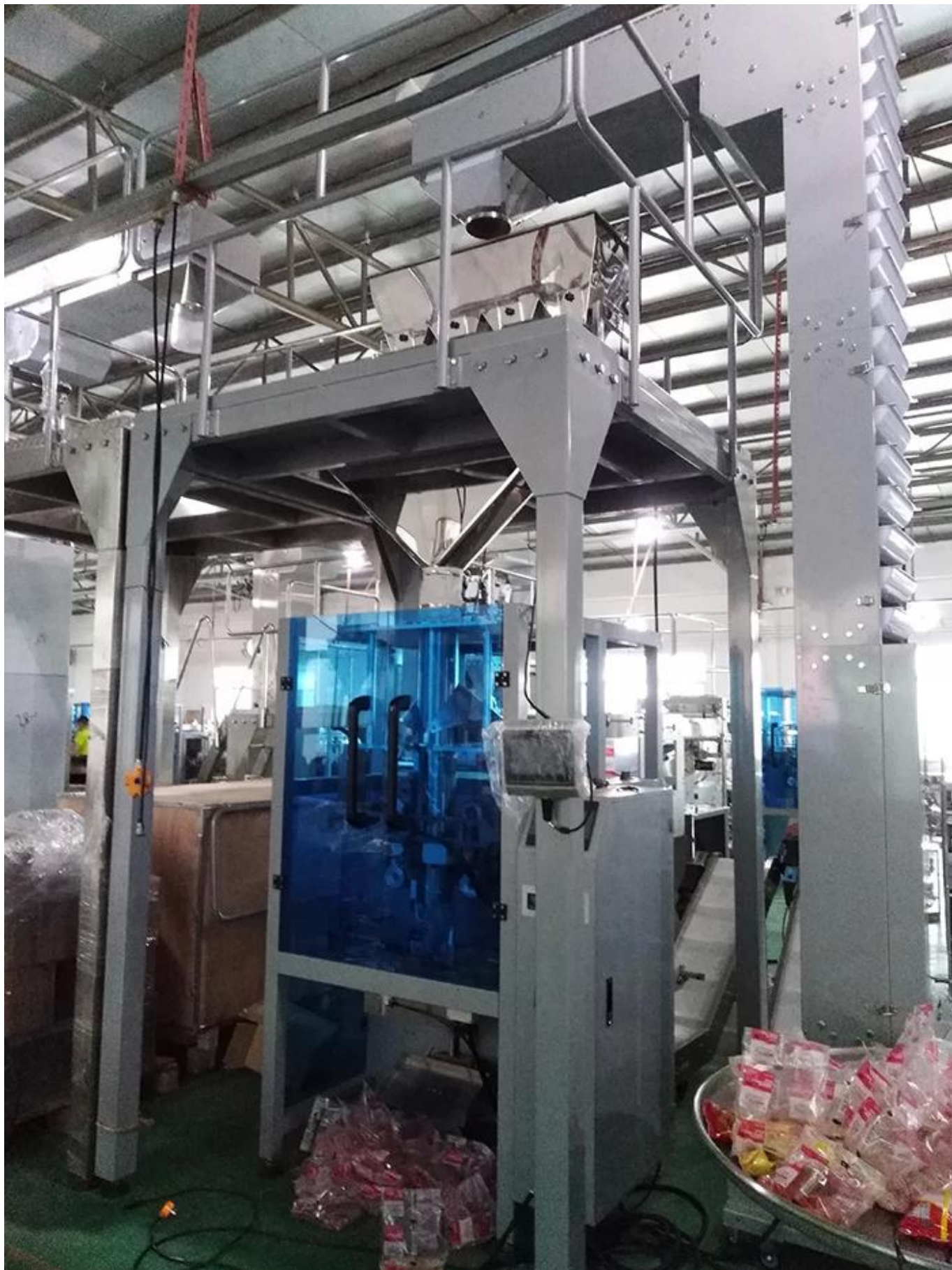
Ponga material en el cargador Z