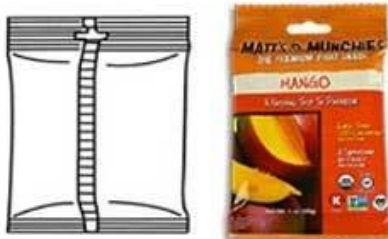
Back Sealing with Euro hole