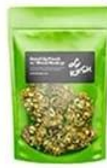
Stand up pouch bag