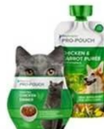
Special shaped bag