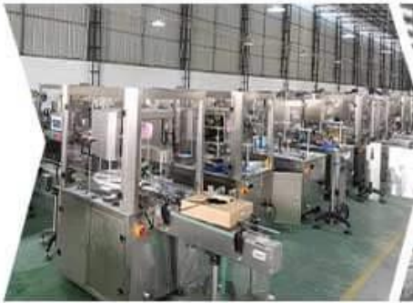
FILLING MACHINE WORKSHOP