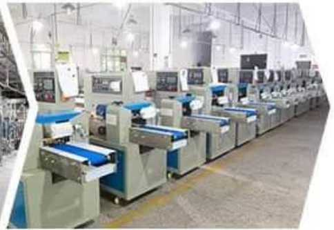
PILLOW MACHINE WORKSHOP