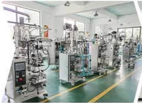
SMALL VERTICAL WORKSHOP