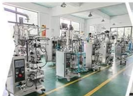
SMALL VERTICAL WORKSHOP