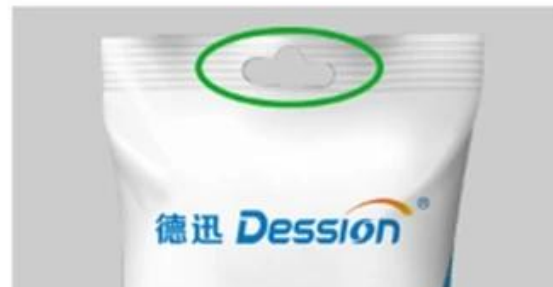
Bag With Hole