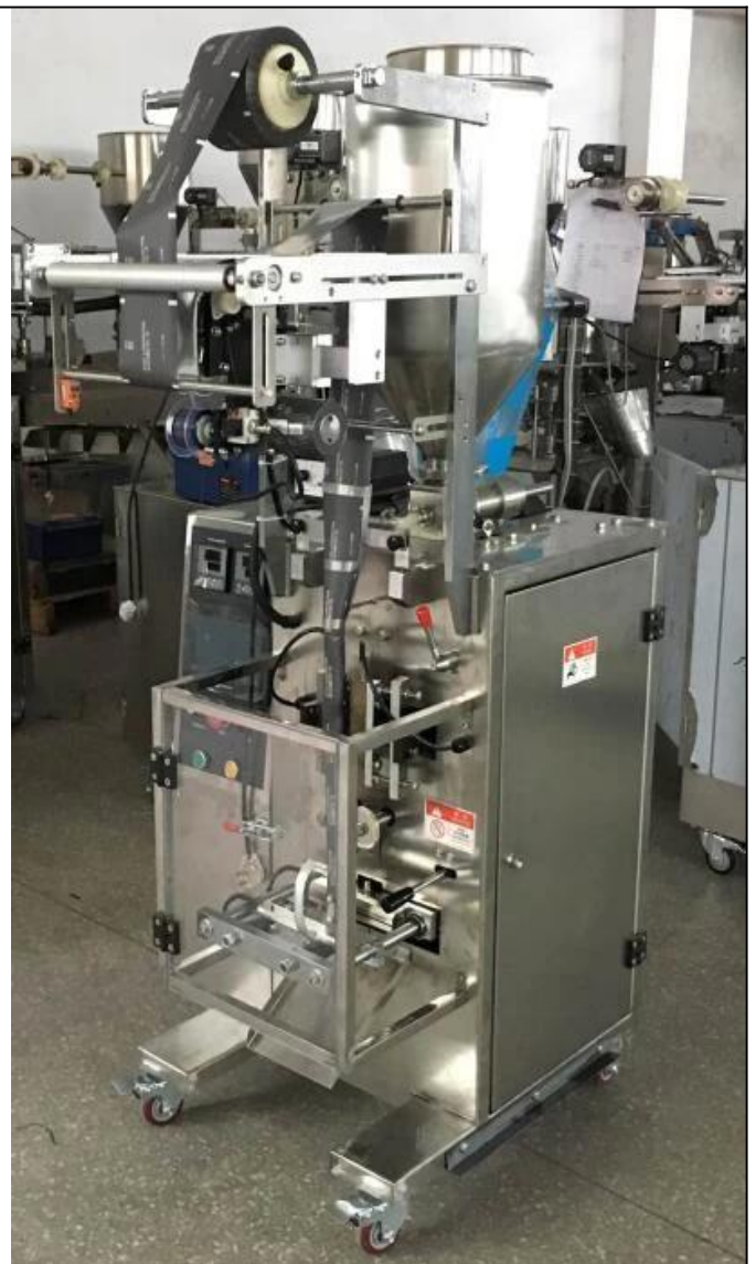
LADO DERECHO DE LA MÁQUINA