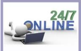
7-24 Hours services