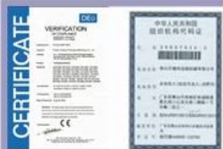
Tight quality control