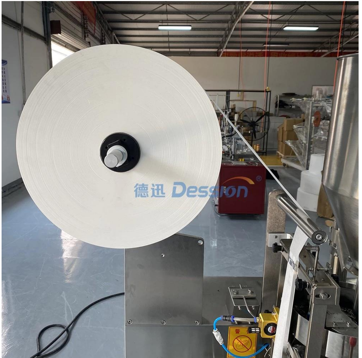
Titular de la película