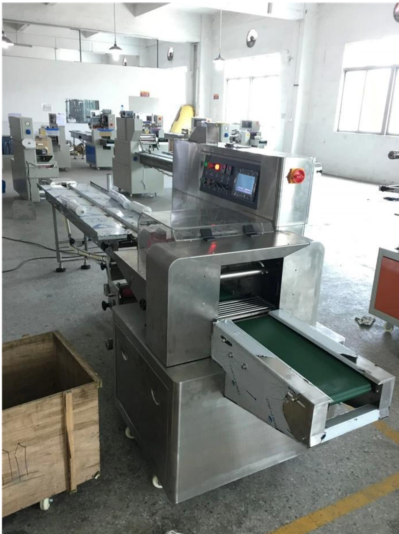
Vista lateral frontal