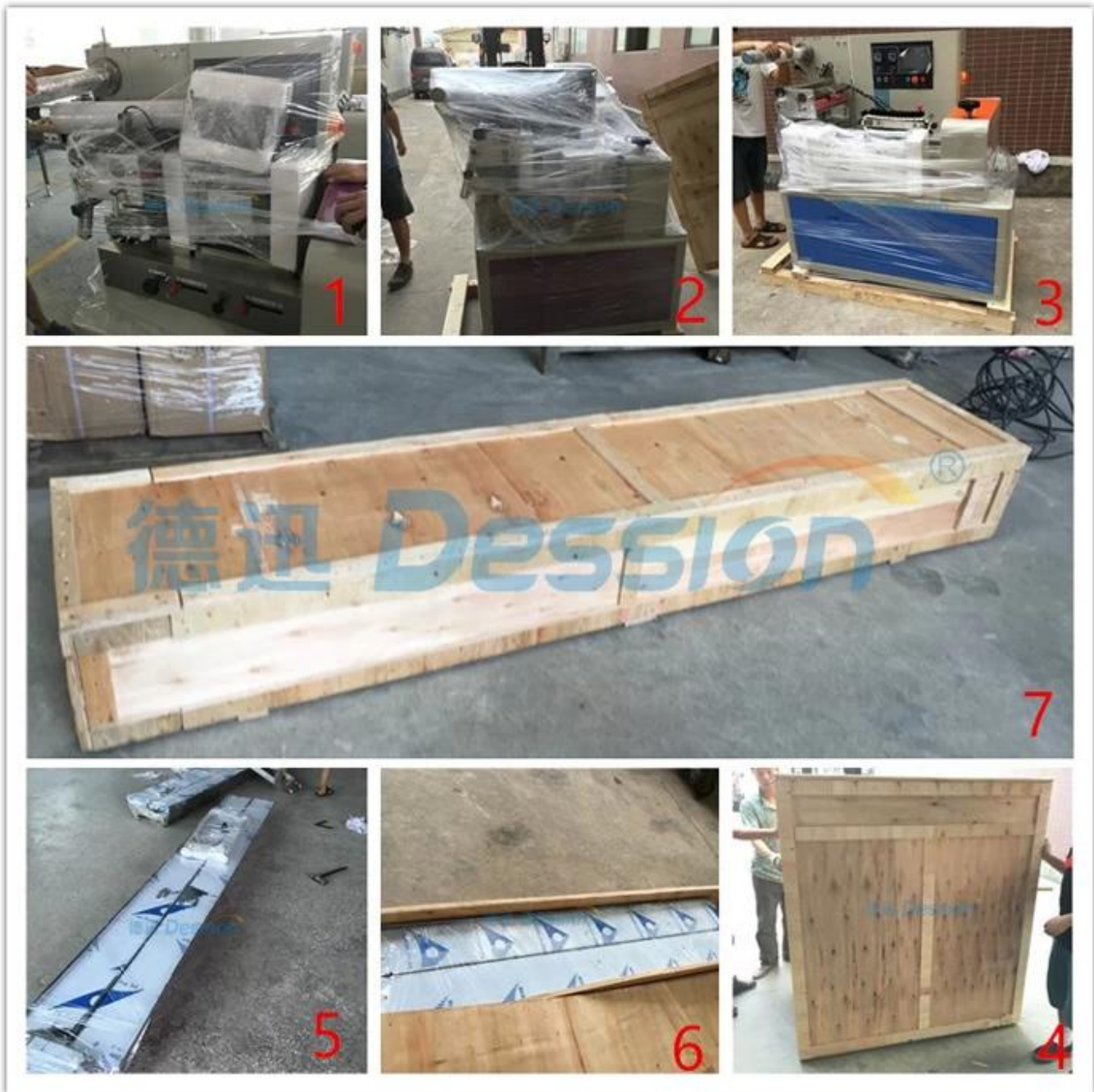
equipo de filtración máquina empacadora horizontal de llenado y sellado