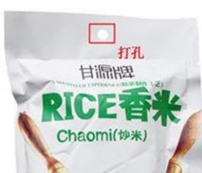
Round Punching Hole