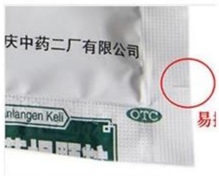
Easy Tearable device