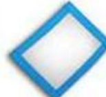
4 sides seal bag