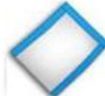
3 sides seal bag