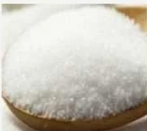
refined cane sugar