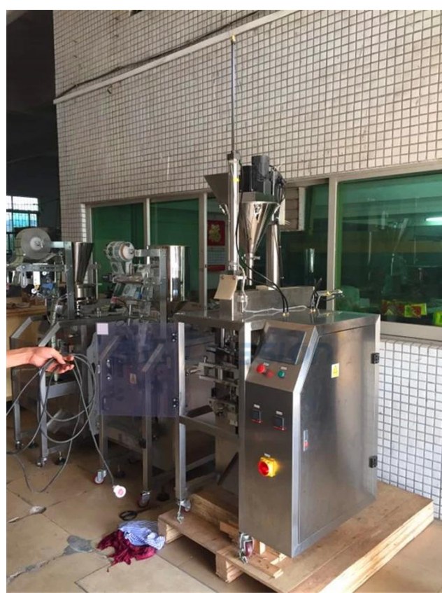
CÔTÉ DROIT DE LA MACHINE