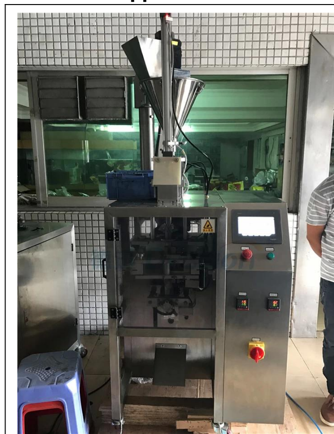
AVANT DE LA MACHINE