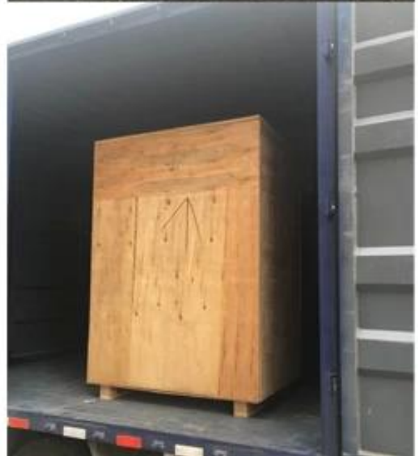
2017 nouveaux produits chauds pour machine à emballer à flux de sel 250g 350g 500g 800g avec dosage à vis