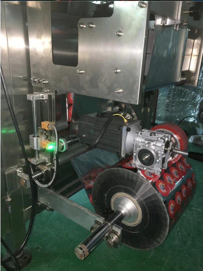
Processus de travail de la machine :