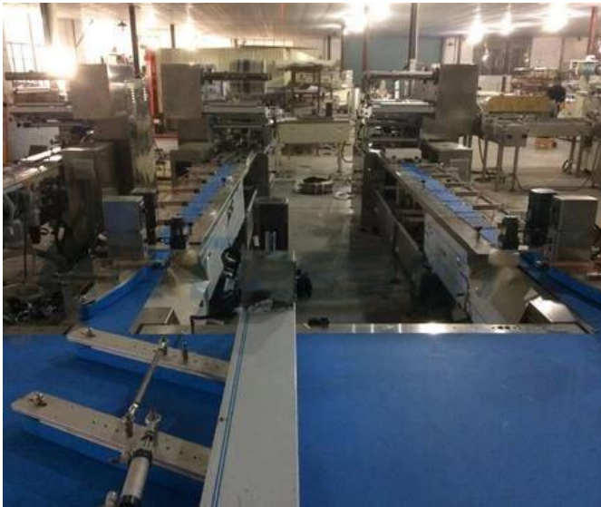
ZONE LOCALE DE LA MACHINE