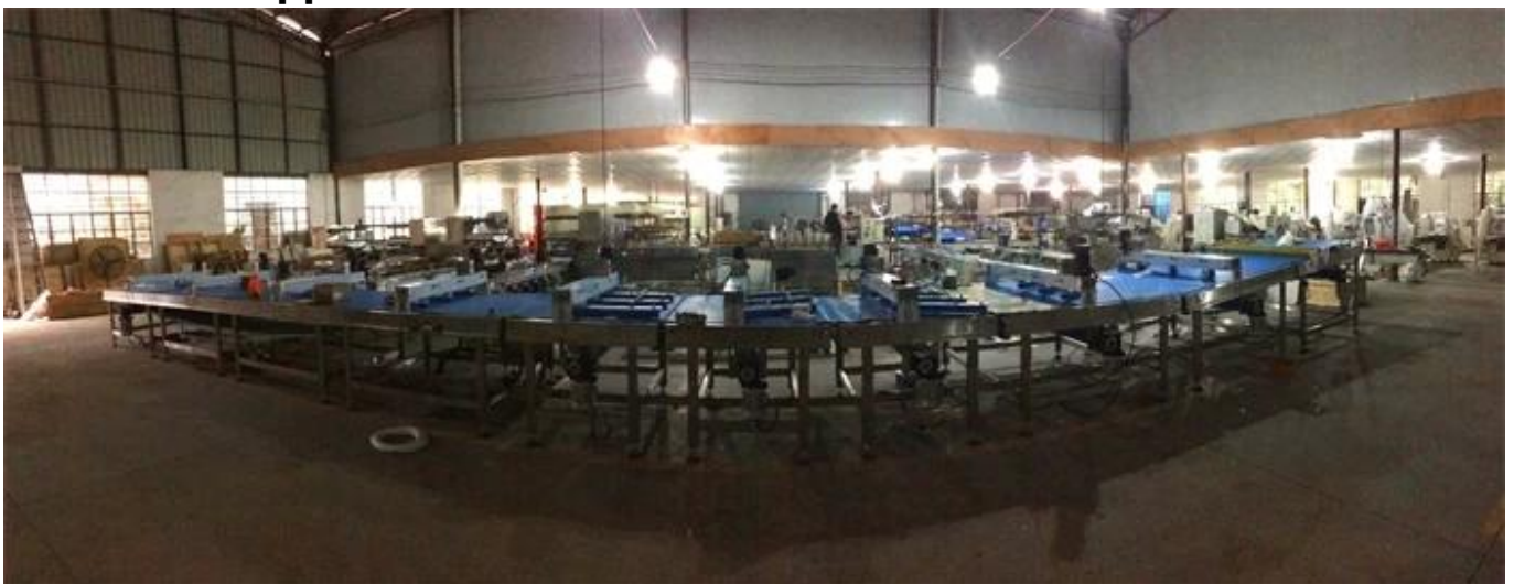
AVANT DE LA MACHINE