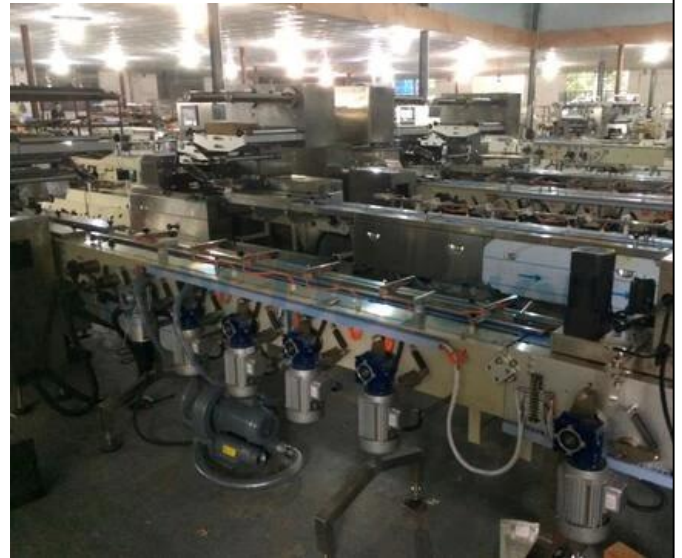
ZONE LOCALE DE LA MACHINE