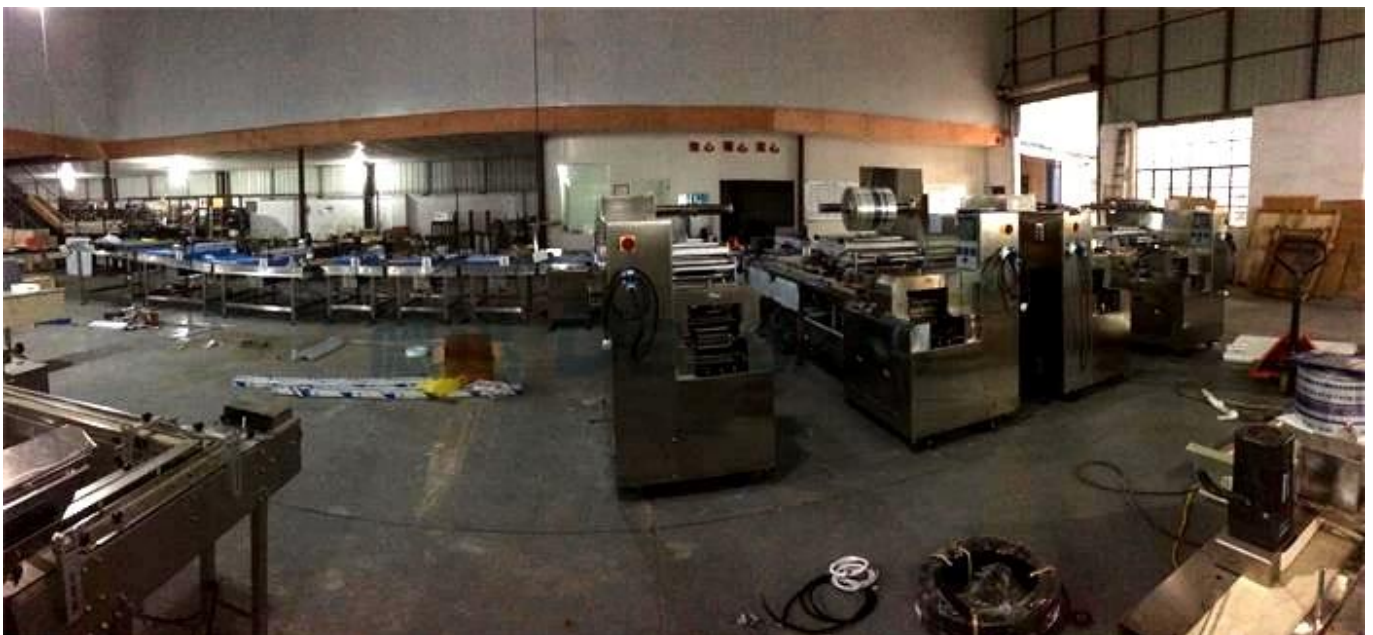
DERRIÈRE LA MACHINE