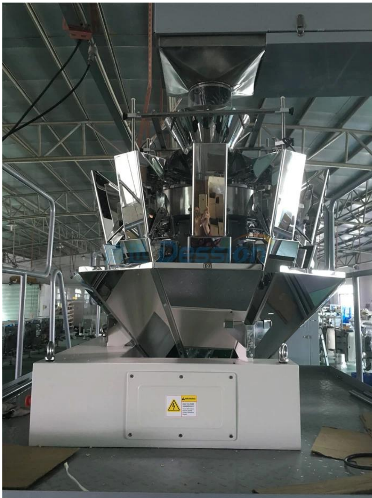
Lecteur à 2 hôtes