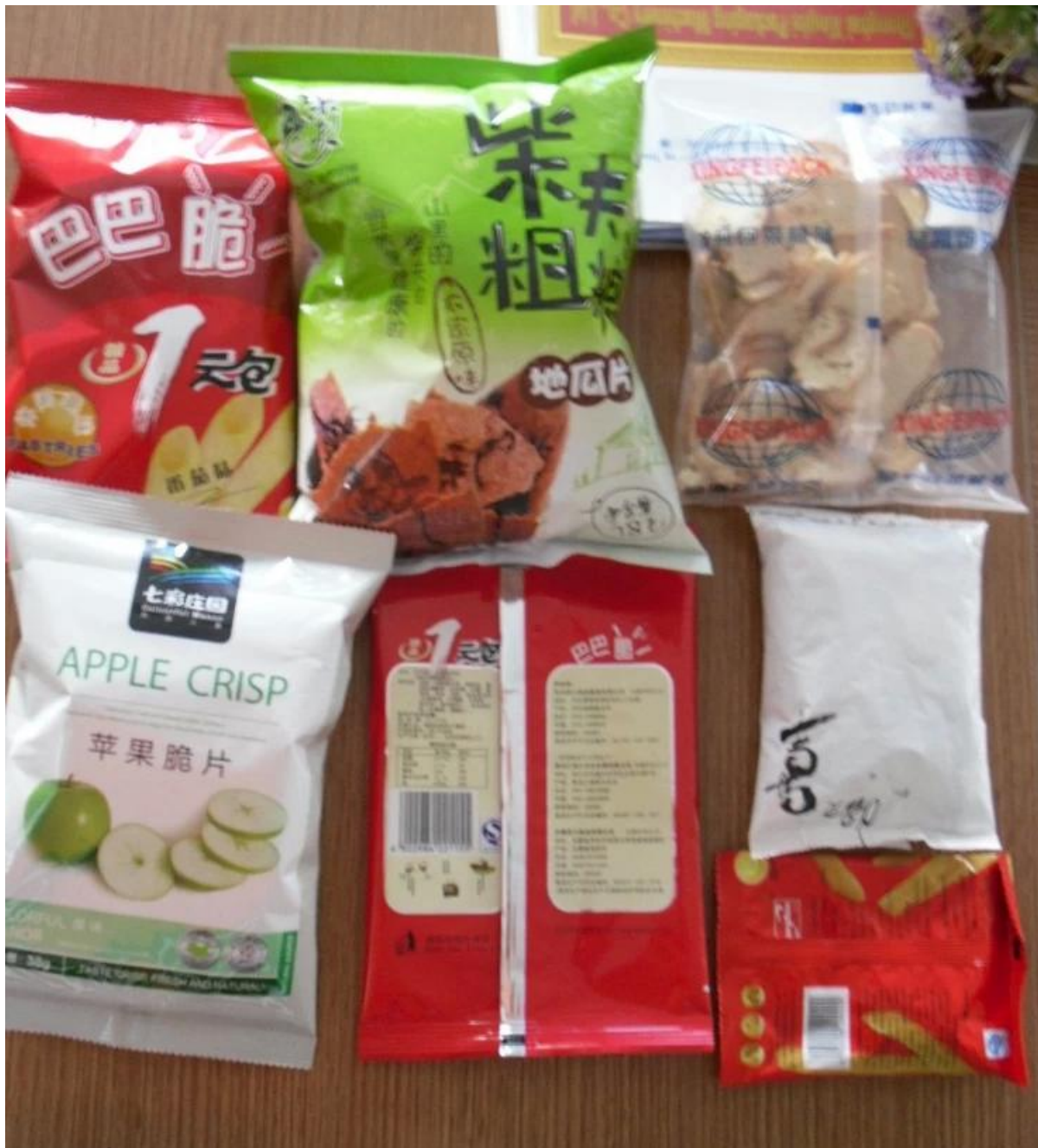
Les pièces de la machine de pesage et d'emballage automatiques montrent : Tête à l'échelle 1.10