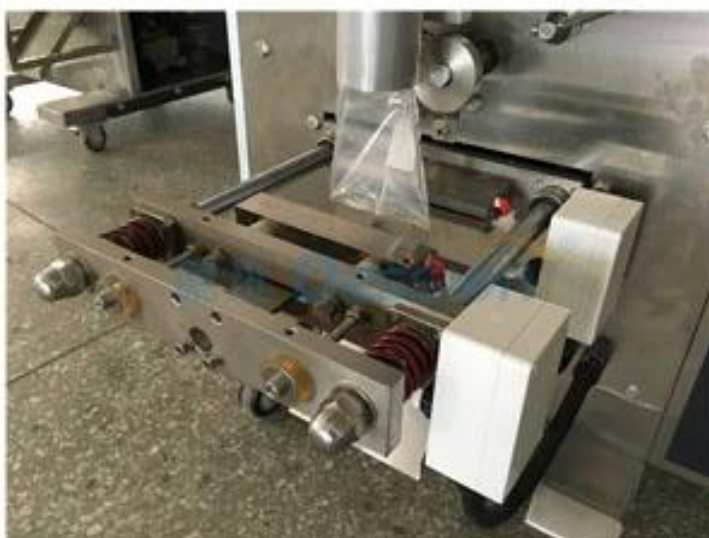
Finition des métaux