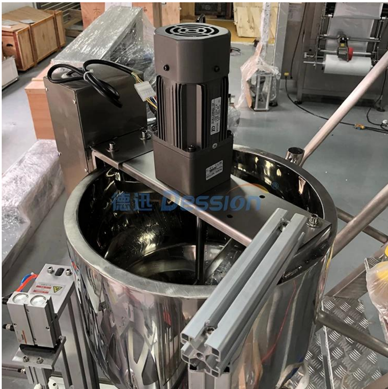
Trémie et dispositif d'agitation chauffant