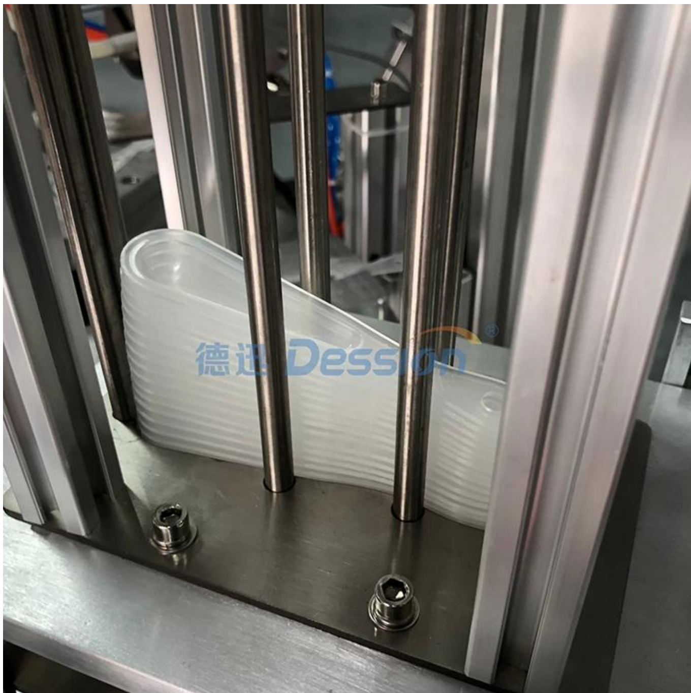
dispositif de chute