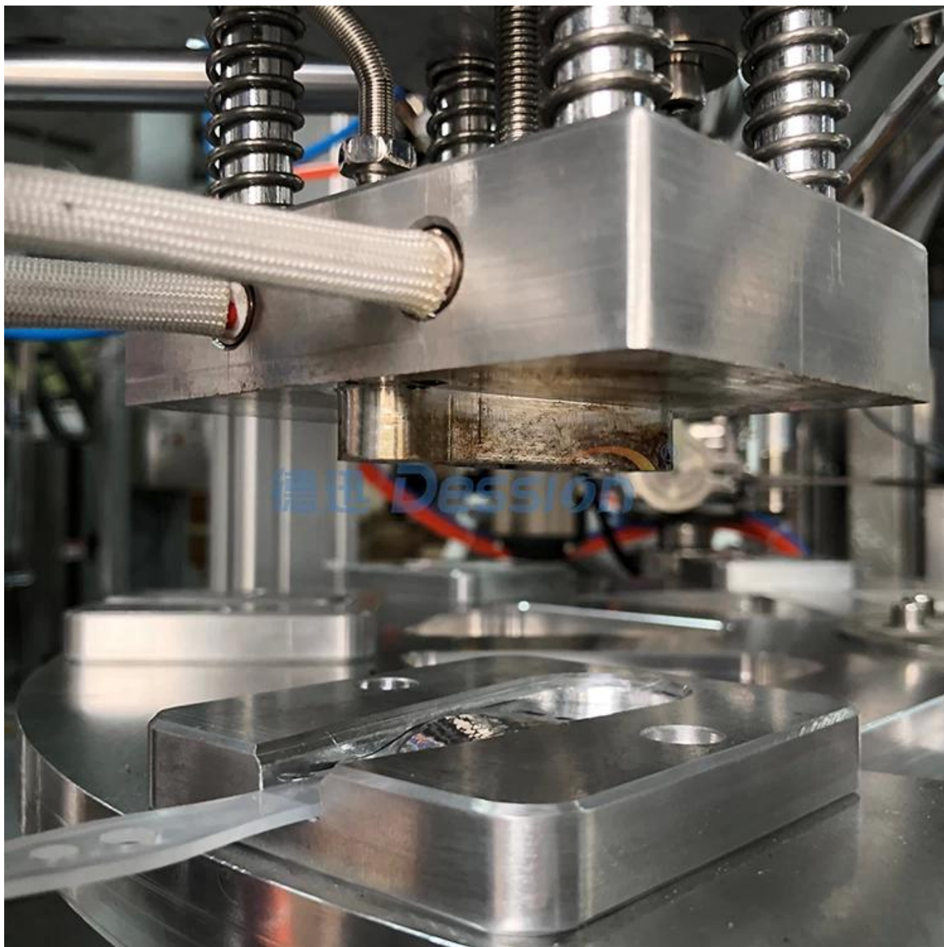
Dispositif d'étanchéité en feuille