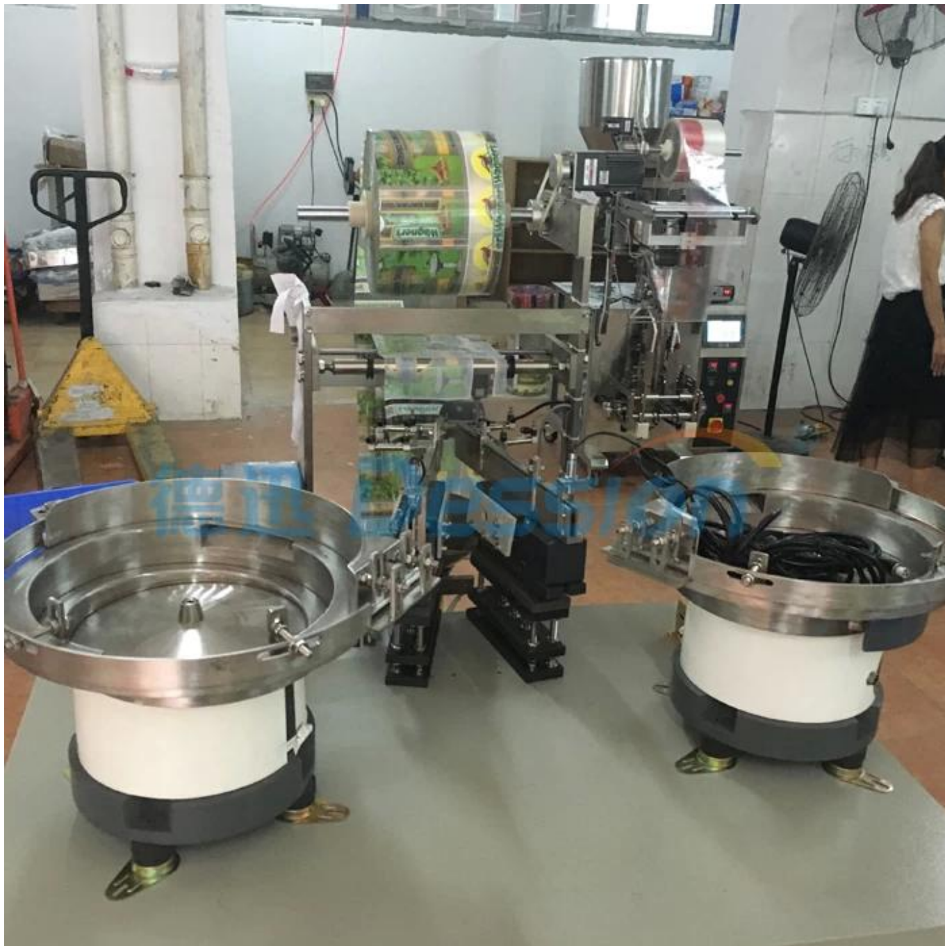
Plaque vibrante pour capsule de café Mettre en place et retourner