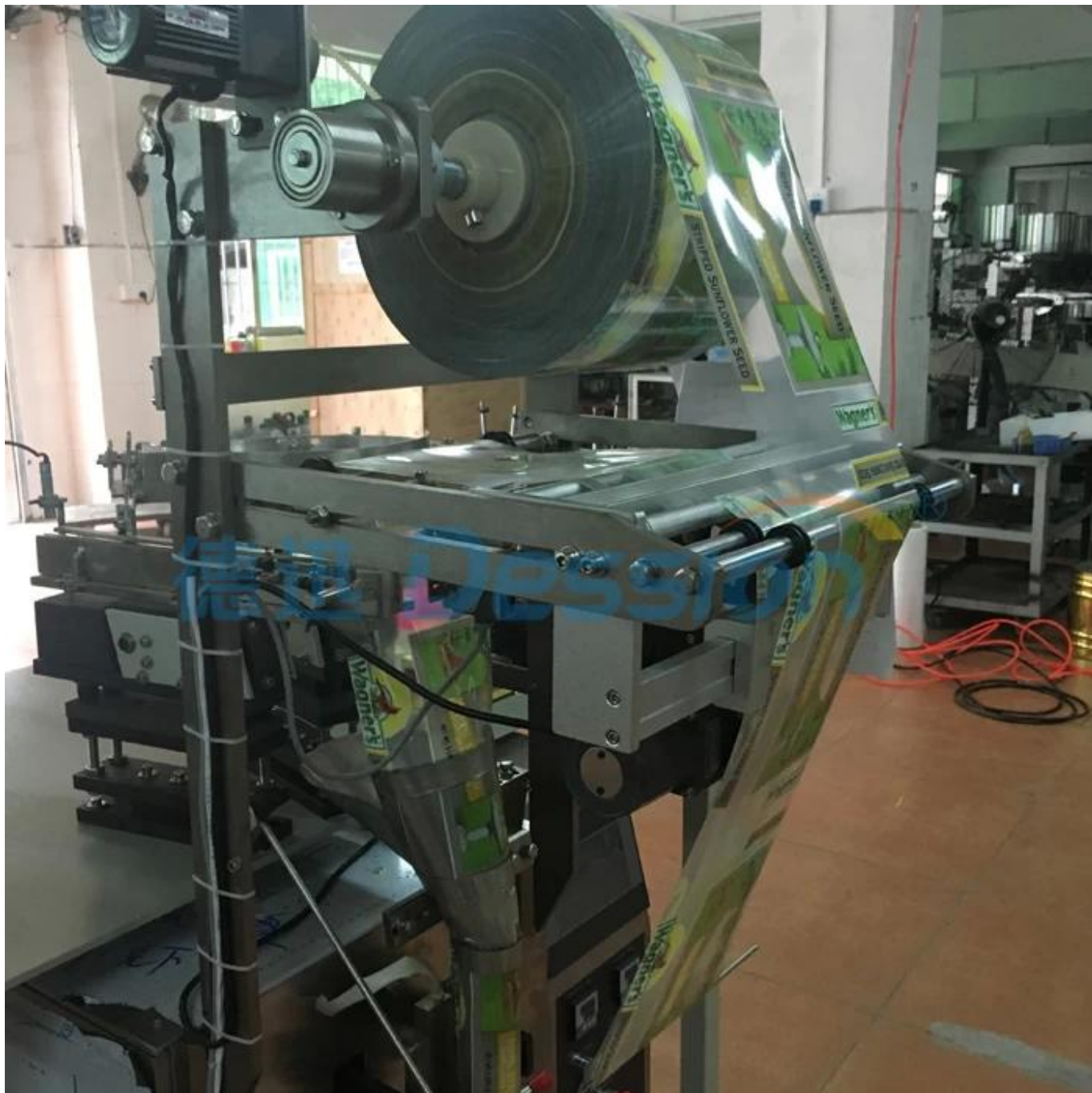
Tirage de films