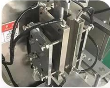
4 Sides Sealing Device