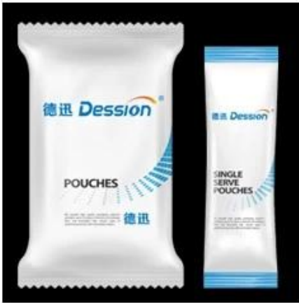
Back Sealing Bag