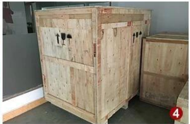
Machine d'emballage de canneberge séchée avec le sac d'emballage de machine