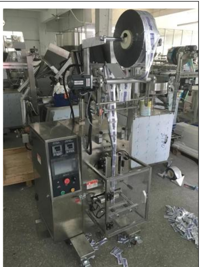
CÔTÉ GAUCHE DE LA MACHINE