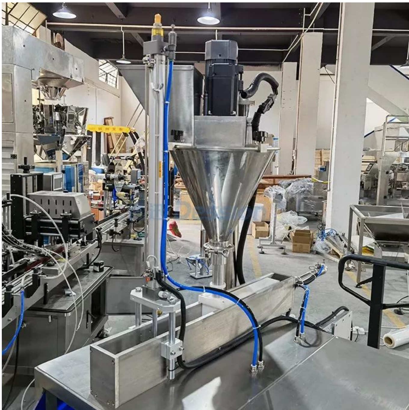
Dosage à vis