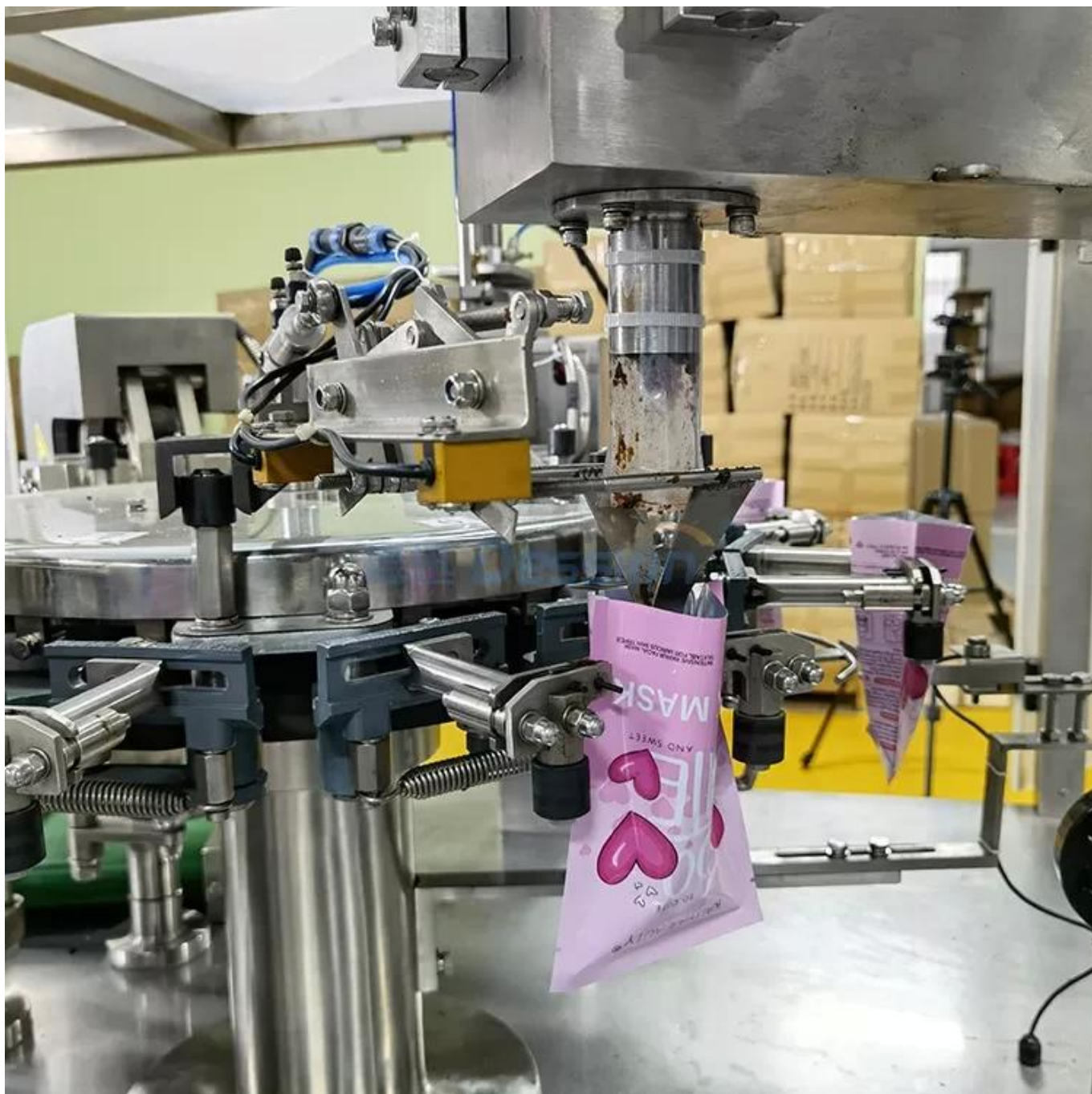
Dispositif de remplissage