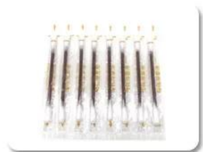
Sterile Cotton Swab