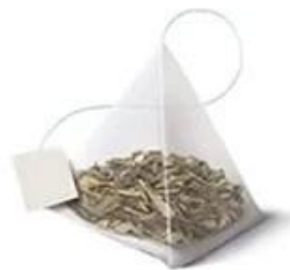
Triangle inner and outer bag