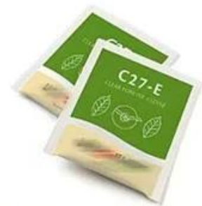
Inner and outer bag Square/Pillow tea bag