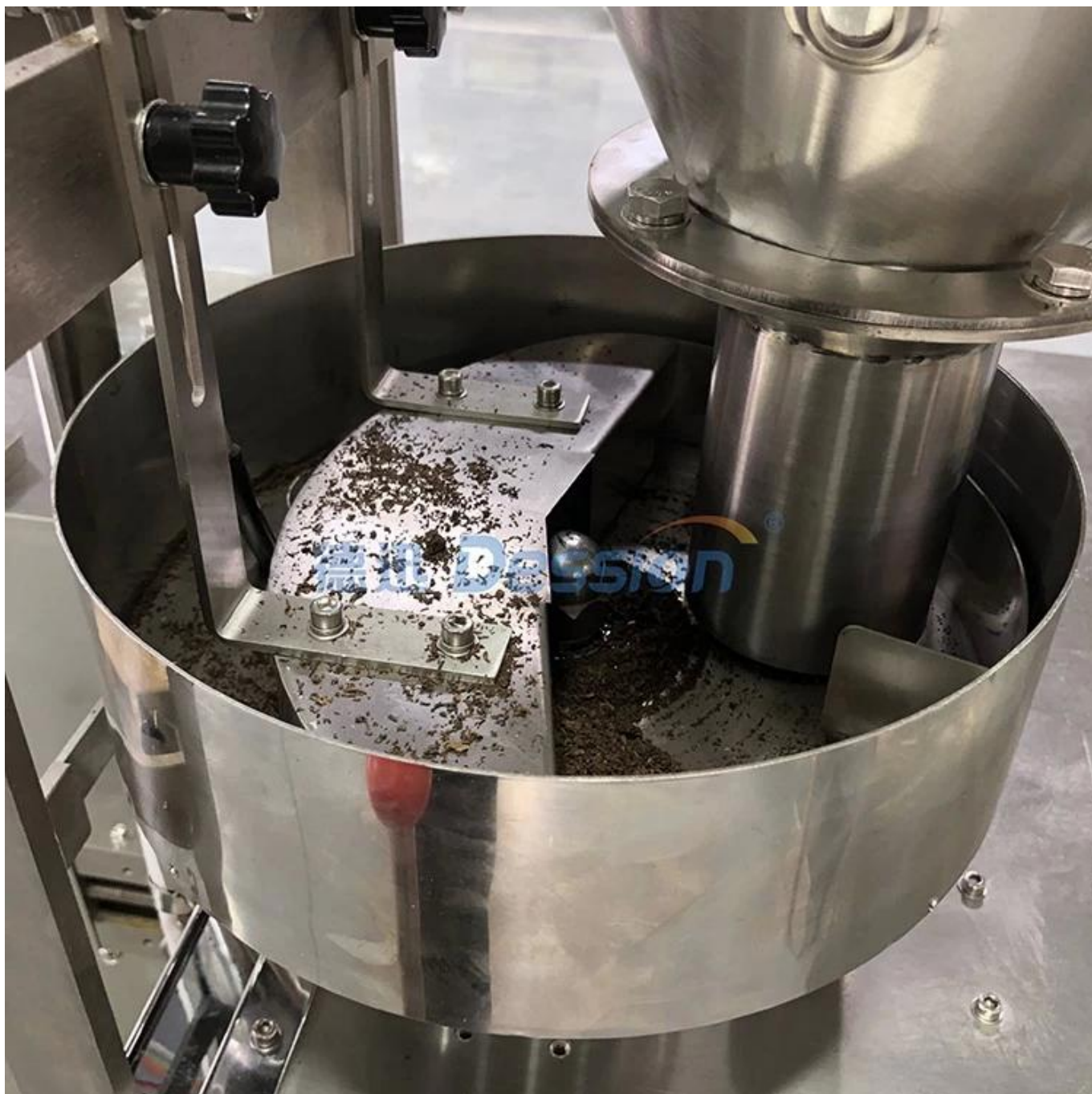
Tasse à mesurer