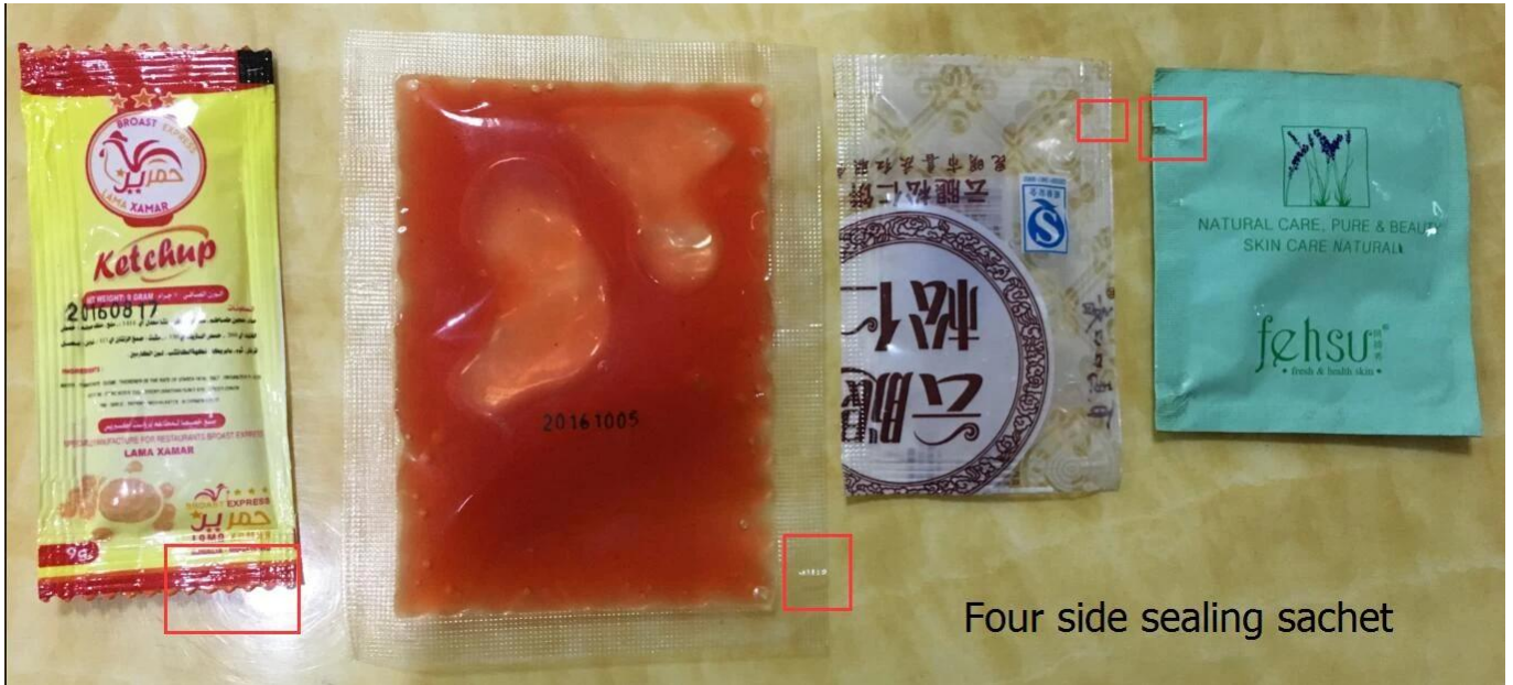
Four side sealing sachet