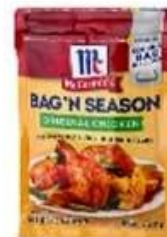
3/4 side seal bag