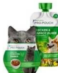
Special shaped bag