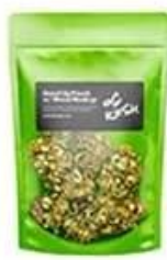
Stand up pouch bag