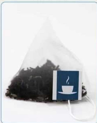
Pyramid Tea Bag