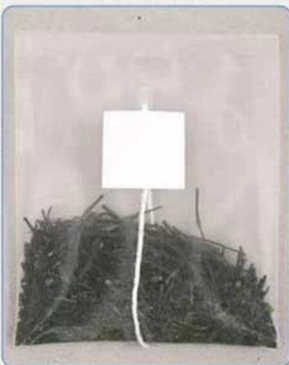
Flat Tea Bag