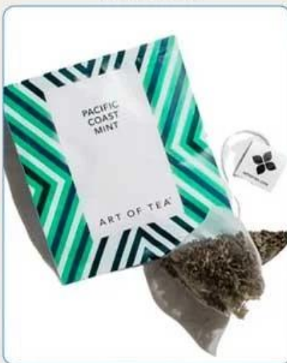
Tea Bag With Envelop